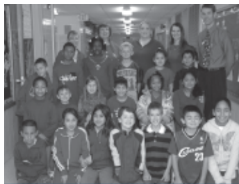
¡La Escuela Primaria Shands se viste de rojo!

Una de cada 3 mujeres morirá a causa de un ataque cardiaco, un derrame cerebral o un tipo de enfermedad cardiovascular. Las enfermedades cardiacas son la principal causa de muerte de las mujeres mayores de 25 años. En febrero, el Mesquite ISD apoyó los esfuerzos de la Asociación Estadounidense del Corazón para concienciar a la gente sobre este problema, y, con este fin, motivó a los estudiantes y a la facultad a vestirse de rojo. ¡Éstas son imágenes de las actividades celebradas en todo el distrito durante el día de Go RED!