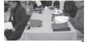
Participantes del Programa A.L.I.V.E. se examinan con un ejemplo del examen TAKS.