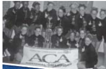
El equipo principal de porristas de la escuela JHHS clasificó en el primer lugar de la competencia de la Asociación Nacional Estadounidense de Porristas.