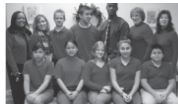
¡La Escuela Media Vanston se viste de rojo!