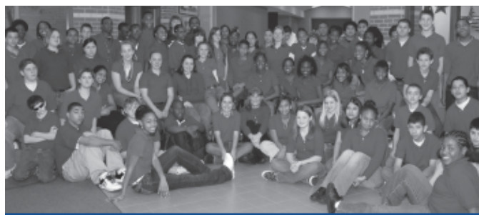
¡La Escuela Media Agnew se viste de rojo!