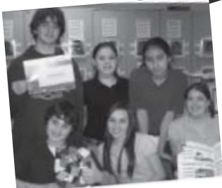
La publicitaria Taylor Publishing otorga un Certificado de Excelencia a los estudiantes miembros del equipo del anuario de la Escuela Media Kimbrough . Dicho reconocimiento se otorgó en la categoría de diseño y cobertura y el anuario de la escuela KMS aparecerá en la publicación de 2007 "Yearbook Yearbook" de la publicitaria.